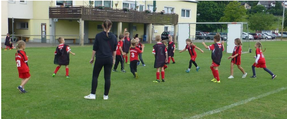
und auch gleich noch beim Handballspiel.