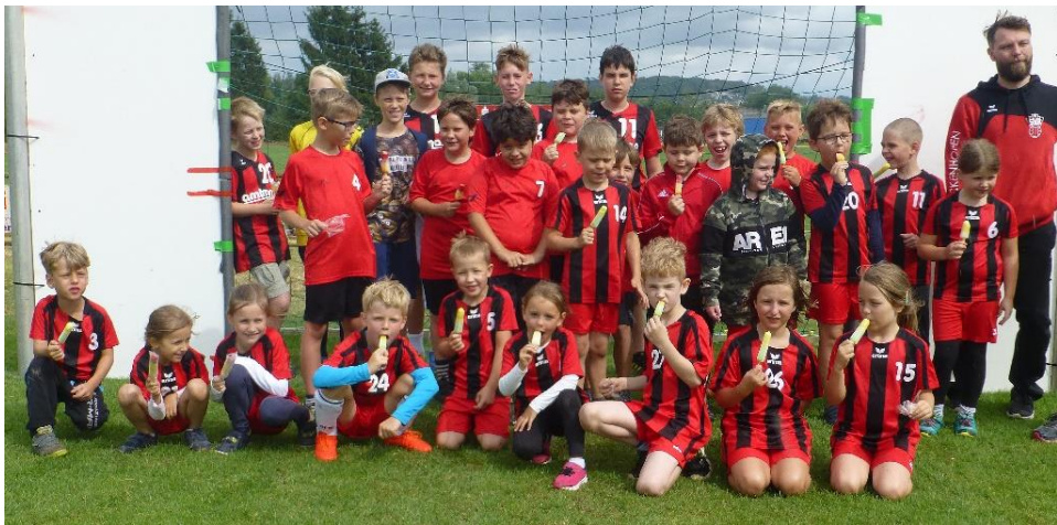
Unsere Handballer mit dem „Belohnungs“-Eis