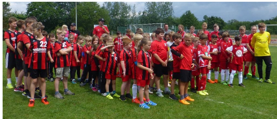
Die Mannschaften bei der Begrüßung

Seit Jahren schon messen sich Fußball- und Handballteams während der Sportlerkerwa in „Kombinationsspielen“. Das bedeutet: Einmal wird Fußball gespielt, die nächste Begegnung findet im Handball statt, und heuer kam noch ein „Rechenwettbewerb“ dazu. Beteiligt waren die Kinder von den Minis bis zur D-Jugend. Hier ein paar Eindrücke: