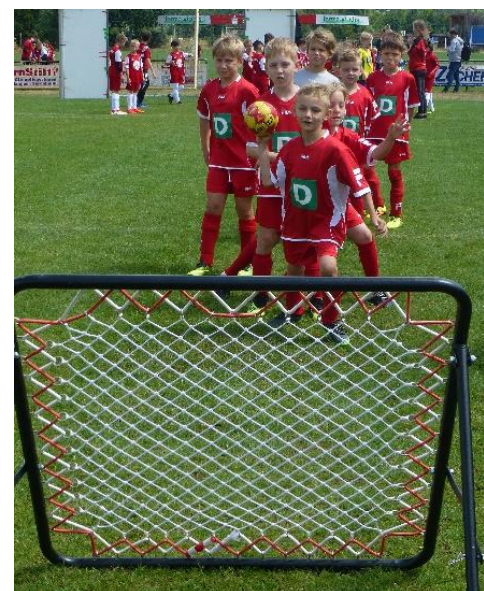
Die Fußballer versuchten sich am Rebounder . . .